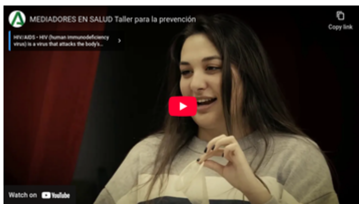
Vídeo Mediadores en salud. Taller para la prevención.